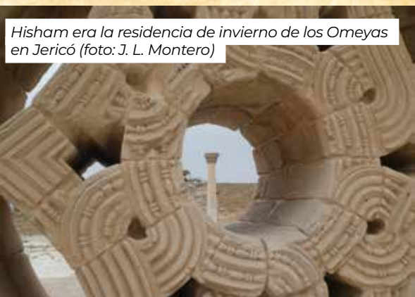
Hisham era la residencia de invierno de los Omeyyas en Jericó

En la actualidad, el Ministerio de Turismo y Antigüedades de Palestina tiene inscritos un total de doce sitios culturales y naturales en la lista tentativa de la UNESCO. Entre ellos, se encuentran la antigua ciudad de Samaría/Sebastia, el palacio Omeya de Hisham (Jericó), el casco viejo de Nablus y sus alrededores (antigua Siquén), y el monte Gerizim y los samaritanos.