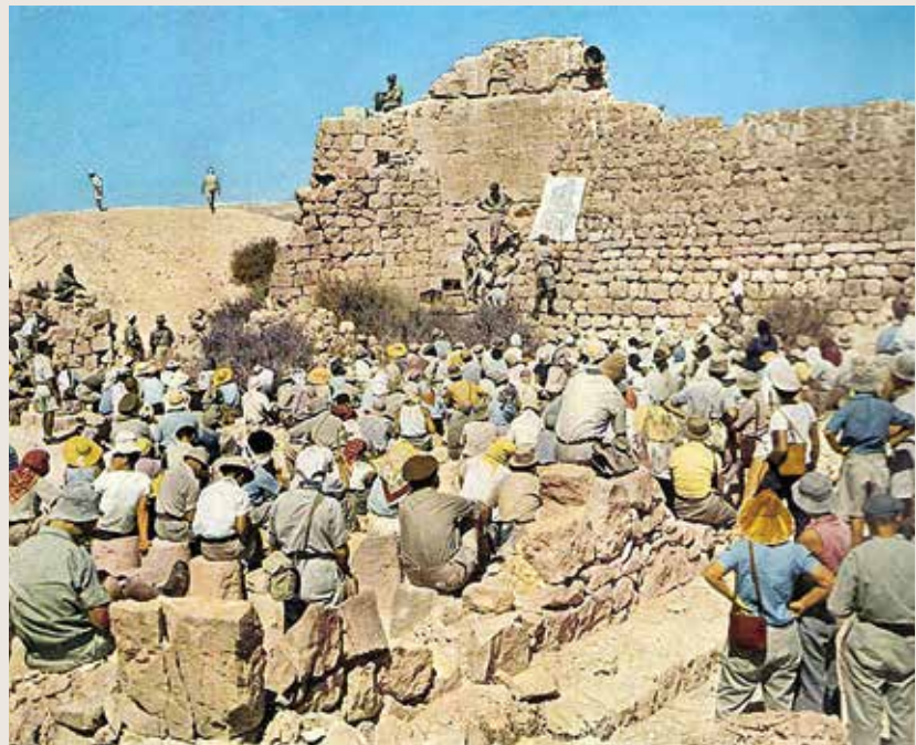
Reunión de la Israel Exploration Society en Shivta, desierto del Néguev, años 50

Hoy en día la IES continúa organizando congresos especializados en universidades israelíes, realiza charlas y ciclos de conferencias para aficionados a la arqueología, edita y publica numerosos trabajos cada año y organiza viajes culturales dentro y fuera de Israel.