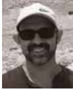
Felip Masó Ferrer Arqueonet, Barcelona

El Calcolítico es una época de gran importancia en el Levante, ya que es el momento de transición entre las comunidades del Neolítico Final (final del V milenio a.C.) y las primeras sociedades urbanas del Bronce Antiguo (inicios del IV milenio a.C.). Este período no solo fue importante por la mejora que supuso el uso del cobre en la fabricación de todo tipo de útiles, sino por la revolución social que comportó. Mientras que el sílex es muy abundante, el co-