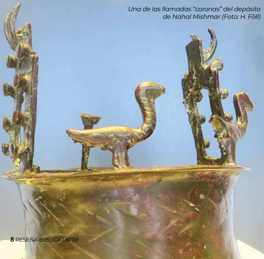
Una de las llamadas "coronas" del depósito de Nahal Mishmar

No se sabe con seguridad cuál es la razón por la cual estos objetos fueron depositados en esta cueva, pero es posible que la proximidad del importante santuario de Ein Guedi (a 12 km) pueda ofrecer una respuesta. Los rituales dedicados al culto de una pareja divina, estrechamente relacionada con la fertilidad de los rebaños que allí se desarrollaban, necesitaban de un conjunto de objetos culturales que muy bien pudieran ser como los encontrados en la cueva de Nahal Mishmar. Cuando se excavó el santuario de Ein Guedi se encontraron algunos fragmentos de cerámicas, el sancta sanctorum y una habitación completamente vacía. Parece que por alguna razón el santuario fue abandonado de forma precipitada; dejaron tras de sí algunos objetos, pero se llevaron consigo los más valiosos para guardarlos en un lugar seguro: la cueva de Nahal Mishmar. ¿Podría ser la habitación vacía del santuario el lugar donde se guardaba este conjunto de objetos religiosos? En cualquier caso, constituyen la muestra más representativa del alto grado de especialización y desarrollo cultural del período Calcolítico.