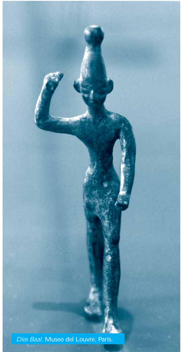
Dios Baal. Museo del Louvre, París.

El Señor habló a Moisés y a Aarón diciendo: «¿Hasta cuándo soportaré a esta comunidad malvada que murmura contra mí? He oído las quejas con las que los hijos de Israel protestan contra mí. Diles: “¡Vivo yo!, oráculo del Señor: según habéis hablado a mis oídos, así os he de hacer. En este desierto quedarán vuestros cadáveres, todos los que fuisteis censados, todos y cada uno, de veinte años para arriba, los que habéis murmurado contra mí. No creáis que vais a entrar en la tierra que juré que ibais a habitar, excepto Caleb, hijo de Yefuné, y Josué, hijo de Nun. Pero a vuestros niños, de los que dijisteis que los tomarían como botín, los llevaré y conocerán la tierra que vosotros habéis despreciado”» (Nm 14,26-31).