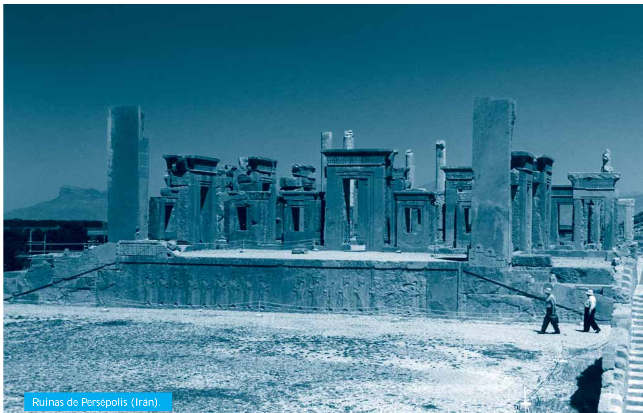
Ruinas de Persépolis (Irán).

Entre estos no se encontraba ninguno de los que Moisés y el sacerdote Aarón habían inscrito cuando censaron a los hijos de Israel en el desierto del Sinaí, pues el Señor les había dicho: «Moriréis irremisiblemente en el desierto y de ellos no sobrevivirá nadie,