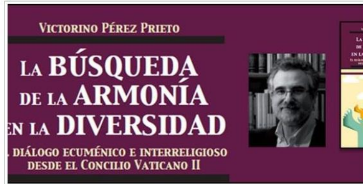
La búsqueda de la armonía en la diversidad (Verbo Divino)