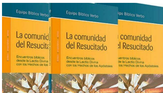
La comunidad del Resucitado Verbo Divino

Una comunidad viva y testimonial que debe superar las dificultades propias de la comunión, y que es guiada por la acción del Espíritu Santo